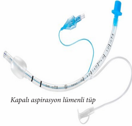
Kapalı aspirasyon lümenli tüp