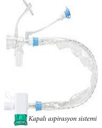
Kapalı aspirasyon sistemi